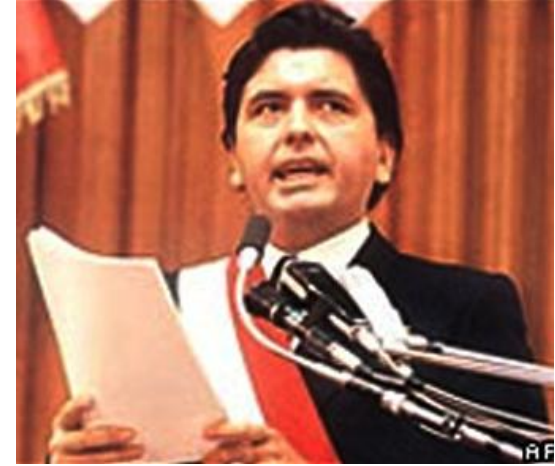
Dr. Alan García Pérez Presidente Constitucional (1985-1990)