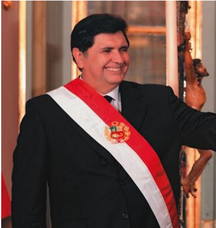
Dr. Alan García Pérez Presidente Constitucional (2006-2011)

DS 055 – 2010 EM Reglamento de Seguridad y Salud Ocupacional en Minería