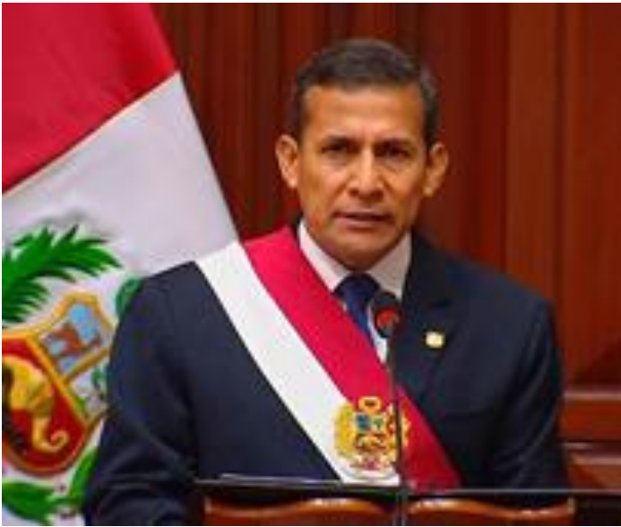
Cmdt. Ollanta Humala Tasso Presidente Constitucional (2011- 2016)