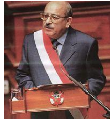
Dr. Valentín Paniagua Presidente de Transición (2000-2001)

DS 046-2001 EM Reglamento de Seguridad e Higiene Minera