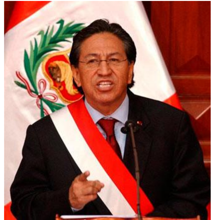
Dr. Alejandro Toledo Presidente Constitucional (2001-2006)