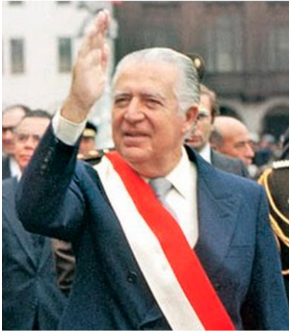
Arq. Fdo. Belaunde Terry Presidente Constitucional (1980-1985)