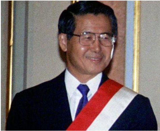
Ing. Alberto Fujimori Presidente Constitucional (1990-2000)